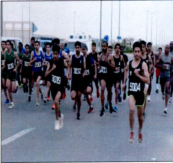
• جانب من سباق اختراق الضاحية