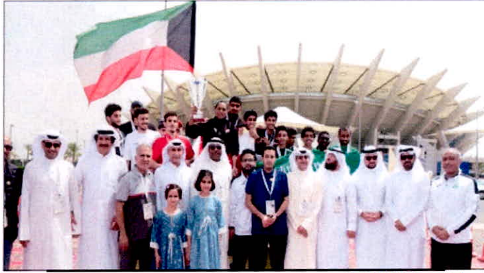
تتويج الفائزين بسباق اختراق السباحة