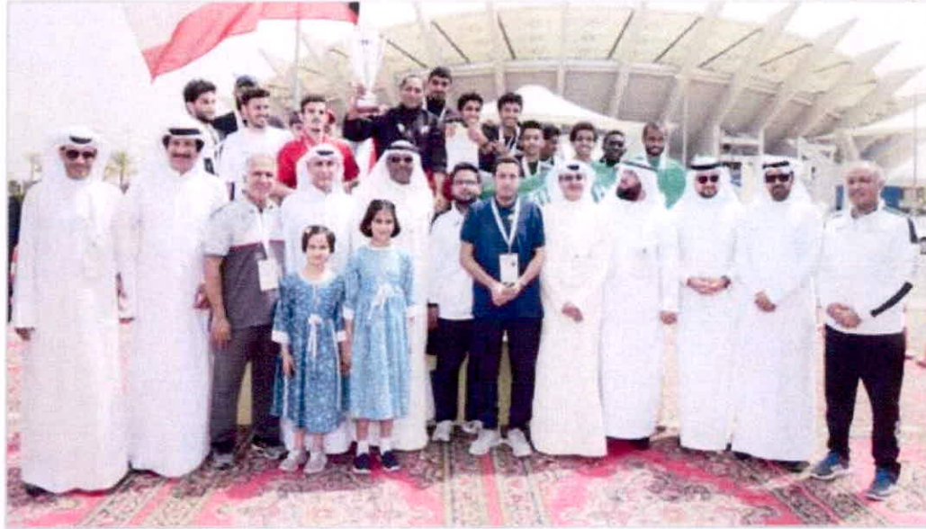
تتويج سباق اختراق الضاحية