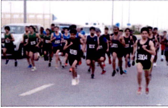
● سباق اختراق الضاحية شهد منافسة قوية وتنظيماً جيداً